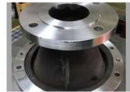
ポンプ部品 吸込カバー (ハイクローム鑄鉄品)