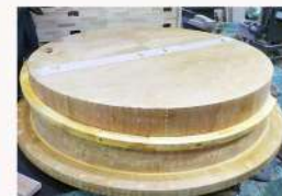
ポンプ部品・木型