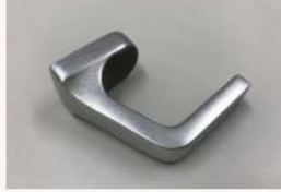
鉄道車両部品 コート掛ケ (AC7A)