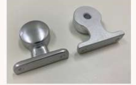
鉄道車両部品 カーテン巻胴受 (AC7A)