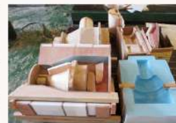
ポンプ部品・木型