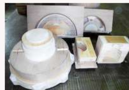
ポンプ部品・木型