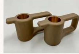
鉄道車両部品 締付具 (CAC403)