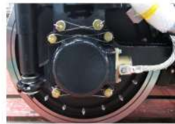
鉄道車両部品 前ブタ (FCD450)