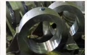
ストーカー部品 ハウジング (SC410)