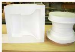
ポンプ部品・発泡型