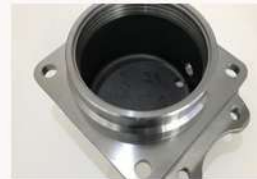
鉄道車両部品 前ブタ (FCD450)