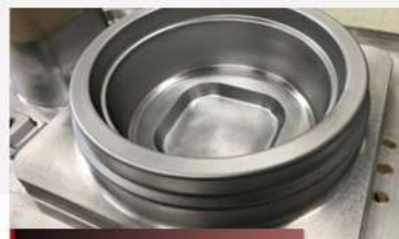
各種木型・金型・一時型製作