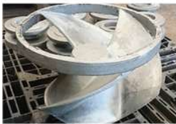
ポンプ部品 羽根車 (SCS13)