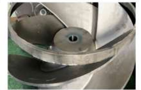
ポンプ部品 羽根車 (SCS13)