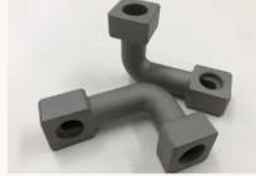
鉄道車両部品 台車用特殊継手 (S25C)