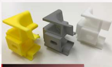
ダイレクトキャスト