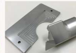
鉄道車両部品 チケットホルダー (AC7A)