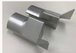
鉄道車両部品 側引戸排障器 (AC7A)