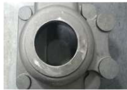
鉄道車両部品 前ブタ (FCD450)