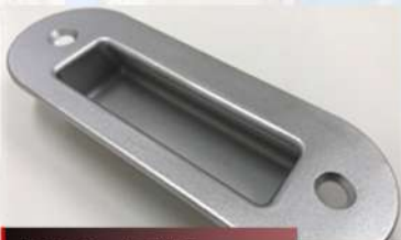
ロストワックス製品

大阪府大阪市城東区に本社を置く古市金属株式会社は昭和32年の創業以来、 鋳鋼品販売業務を中心に、精密鋳造品・鉄道車両部品・ポンプ用鋳鋼品など様々な 加工技術を培ってまいりました。 お客様に喜ばれる仕事をしたい、間違いの少ない仕事をしたい、仕事を通じて自分も成長していく、 そんな会社を目指しています。