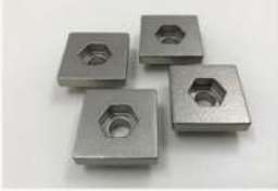
鉄道車両部品 特殊座金 (SCS13)